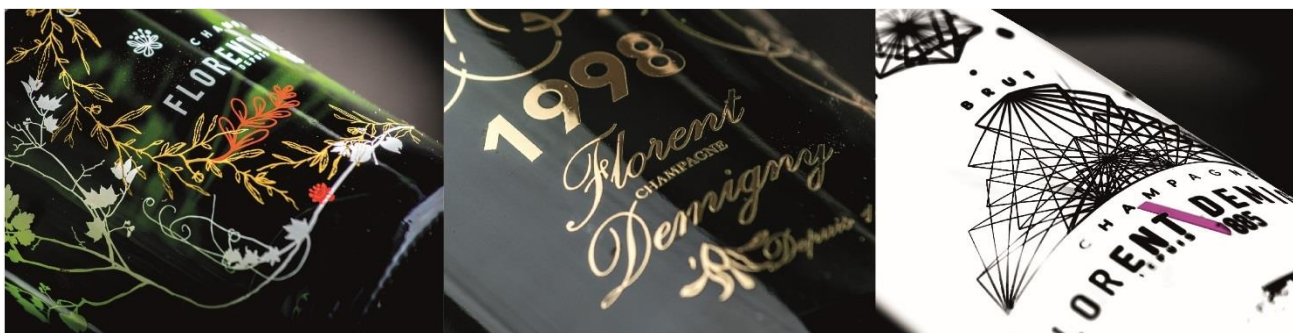
Sérigraphie blanche, rouge & bistre