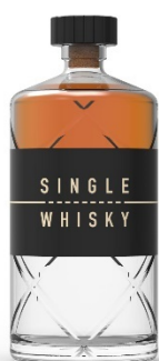
3 Single whisky, de Arnaud Grihl