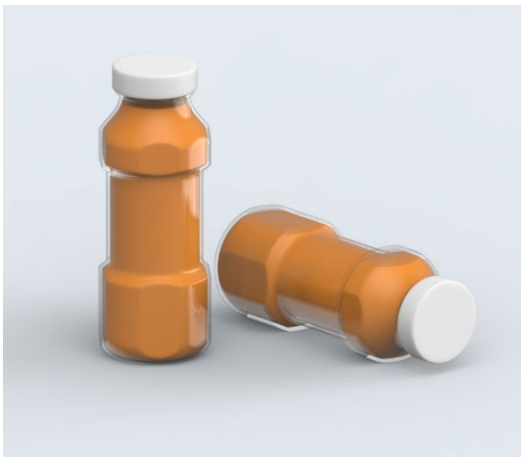
5 Terre à TER, de Clara Uzunovic et Roksana Beraud