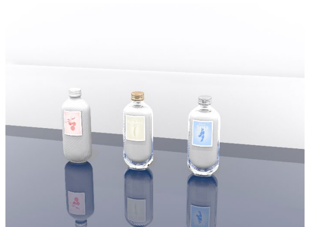
6 Éclat lacté, de Nastassia Erhel

Éclat lacté s'intéresse aux laits végétaux (amande, coco, soja, avoine) que le consommateur connaît aujourd'hui essentiellement dans un emballage en brique carton. Cette bouteille prend la forme et le volume naturellement ovale d'une graine ou d'une coque. Un motif en réseau tramé imite l'enveloppe de la graine et le dessin des champs. Les 25 cl ont été réfléchis pour correspondre à la quantité de lait versé sur les céréales du matin, ou encore pour agrémenter deux cappuccinos. Grâce à un bouchage vis, il est également possible de réutiliser cette bouteille en gourde.