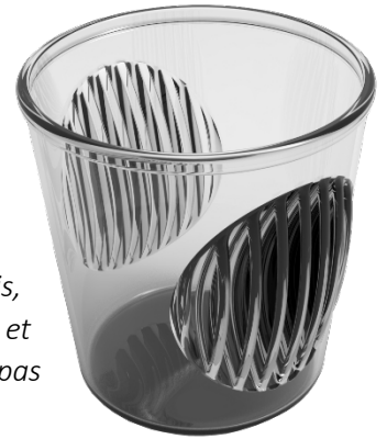
4 Wingsi, de Inès Lupia

« La première démarche a été de chercher un produit qui n'est pas souvent, voire jamais, conditionné dans un emballage en verre. Rapidement, je me suis orientée vers les bacs et les pots de crème glacée. En effet, les pots existants sont souvent en carton et ne sont pas très solides. Ils sont facilement déformés ou percés lors de la dégustation ».