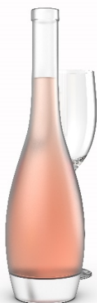
1 Solitarius, de Léonard Laudet