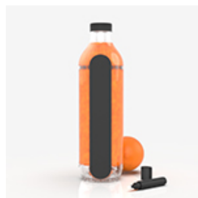
2 Bombe sanguine, de Laura Stelz

« Le marché du jus de fruits est actuellement en plein essor. En 2018, 1 foyer sur 8 est acheteur de jus fraîchement pressé en magasin et ces jus représentent 14% des achats de jus d'orange. C'est pourquoi il m'est venu l'idée de trouver une solution pour arrêter d'utiliser et de gaspiller du plastique en créant une bouteille dite « consignée » ou tournée vers la même utilisation que le vrac ».